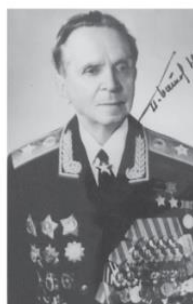
Свою фотоплашку с личной подписью Павел Батов прислал по почте.

Павел Батов — знаменитый участник Великой Отечественной войны. Он участвовал в боях за освобождение нашего района. Музей дорожит теми экспонатами, которые хранят память об этом человеке. Это личные вещи Павла Ивановича: мундир (расово-летнее пальто) и фуражка, а также папка с диктофонами и грамотами, которыми он был награжден правительством различных государств. ... Сам Павел Батов прислал свою фотографию с личной подписью и неординарно одяну к нему в Москву. А в 1975 году Павел Батов побывал с визитом в Курск. Он участвовал в торжественных мероприятиях в честь 30-летия Дня Победы. Встретился со своими боевыми товарищами, посетил место боевой славы. В то время ему было уже 78 лет. История этого визита отражена на стенде в музее.