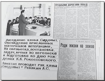
В музее хранится альбом, посвященный клубу «Снедоплет». Он рассказывает, как собирались материалы.

«Хранилище в музее и коллекция глав военных архивов с 1941 по 1945 год «Сталинский удар», «Вперед», «Советский патриот», «Меткий артиллерист», «За победу», «В последний час», «За Родину», «Вперед», «Вперед», «За Родину». Все газеты подлинные, их представляли ветераны. Также в музее можно увидеть листовки, которые выпускались во время войны, истинный офицерский планшет с боевой картой, планы обороны, документы военного времени, юбилейные награды. Среди их важнейших экспонатов музея — священная сталинская земля. Она подарена кровью советских воинов, защитивших восточную границу, и взята с мест самых ожесточенных боев и беспримерных подвигов в период Сталинградской битвы, на Мамаевом кургане. Рядом с ней хранится копия священной земли из Брестской крепо-